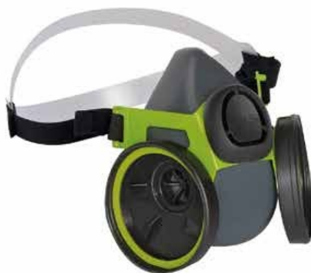
▲ TP2000R semimaschera a 2 filtri in gomma Fornita senza filtri