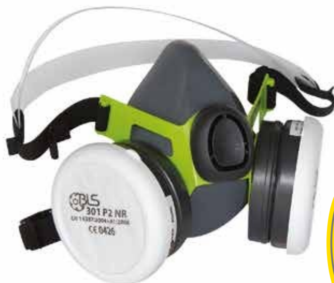
▲ TP2100 semimaschera in gomma completa di filtri A2P2 Fornita in busta richiudibile