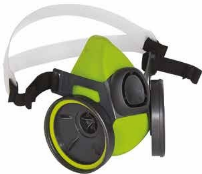
▲ TP2000S semimaschera a 2 filtri in silicone Fornita senza filtri