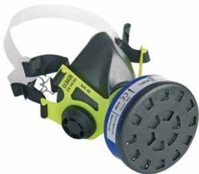
▲ SGE 46 semimaschera in gomma con raccordo DIN Fornita senza filtri