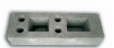
818 Base in cemento per reti peso 33 kg. ca.

403 Rete recinzione cantiere Rete in polietilene ad alta densità per lunga durata, indeformabile, mantiene il proprio colore (arancio) inalterato nel tempo. Facile da posare e riutilizzabile. Dimensione rotolo: