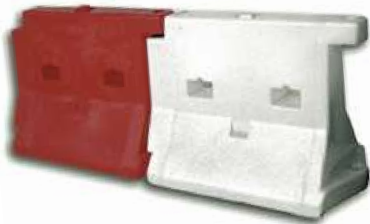
B408 Barriera in polietilene tipo NEW JERSEY mm 1000 x 500 x 800 h