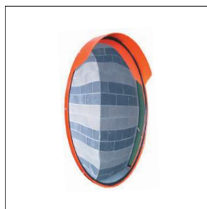
B 203 Specchio parabolico infrangibile in plastica Ø 60 cm. Attacco per palo Ø 60 mm.