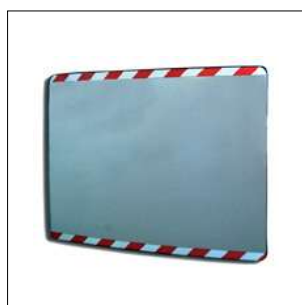
N203 Specchio 40x60 cm