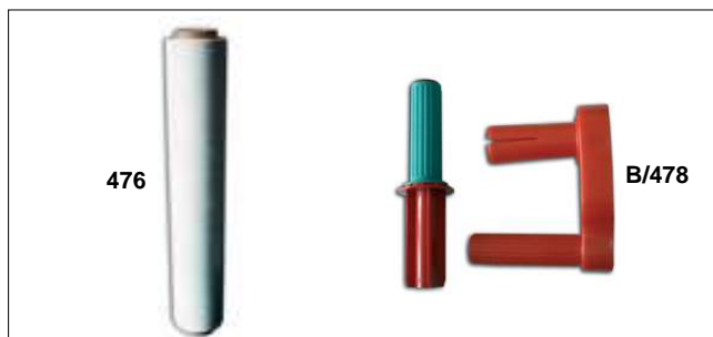
476 Rotoli film estensibili in polietilene per imballo. Bianco o