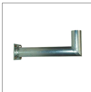
120 Staffa a muro Ø 60 mm. per