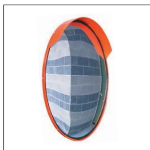
D 203 Specchio parabolico infrangibile in plastica Ø 80 cm. Attacco per palo Ø 60 mm.