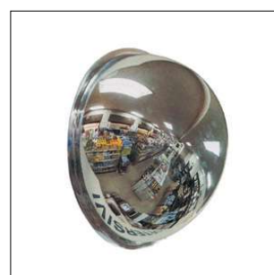
F 203 Cupola Ø 60 cm.