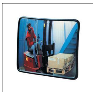
L203 Specchio 40x60 cm infrangibile