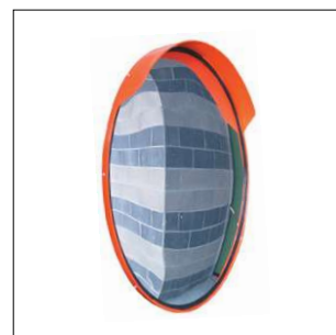
C 203 Specchio parabolico infrangibile in plastica Ø 70 cm. Attacco per palo Ø 60 mm.