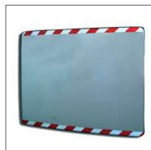
O203 Specchio 60x80 cm