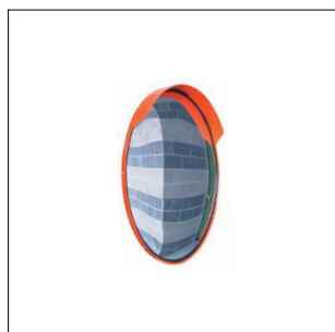
203 Specchio parabolico infrangibile in plastica Ø 30 cm. Attacco per palo Ø 60 mm.