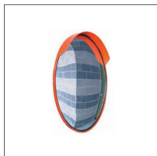
A 203 Specchio parabolico infrangibile in plastica Ø 50 cm. Attacco per palo Ø 60 mm.