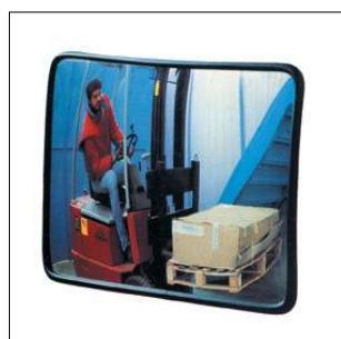
M203 Specchio 60x80 cm infrangibile