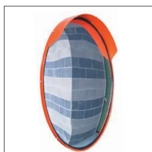
E 203 Specchio parabolico infrangibile in plastica Ø 90 cm. Attacco per palo Ø 60 mm.