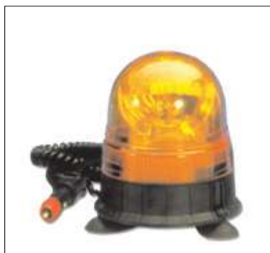
20432/M Girofaro a base magnetica con ventose Dimensioni: Ø 144 mm. h. 169 mm. Calotta in policarbonato. Col. arancio, 12 V.