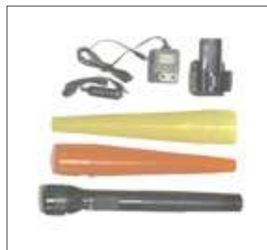
865 Torcia alogena ricaricabile in alluminio ricaricabili, ricaricabatterie 12/220V, coni rosso e giallo. Durata 1,5 ore.