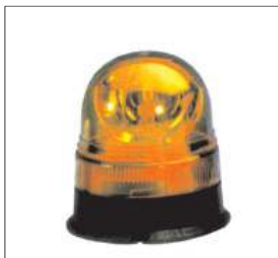
20432 Girofaro a base piana Dimensioni: Ø 144 mm. h. 151 mm. Calotta in policarbonato. Colore arancio, 12 V