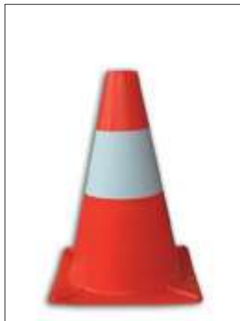
142/P Cono in plastica h. cm. 30 1 fascia bianca