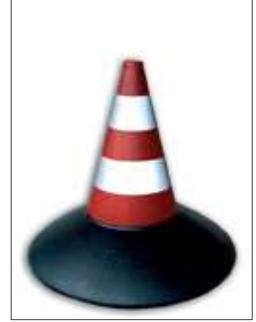
143/1 Cono in gomma base pesante h. cm. 33 a 2 fasce rifrangenti cl.1 143/2 Cono in gomma base pesante h. cm. 33 a 2 fasce rifrangenti cl.2