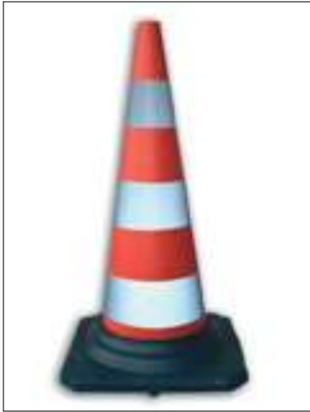
140/1 Cono in gomma h. cm. 75 a 3 fasce rifrangenti Classe 1 140/2 Cono in gomma h. cm. 75 a 3 fasce rifrangenti Classe 2