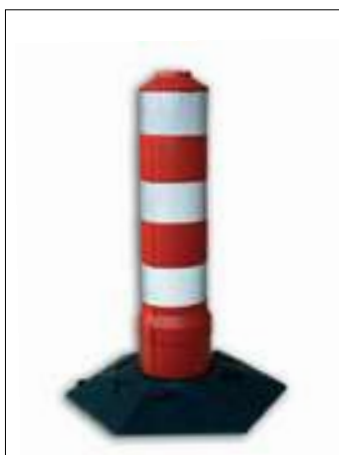
147/1 Delineatore starflex h cm. 35 a 3 fasce rifrangenti cl.1 147/2 Delineatore starflex