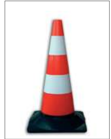
144/P Cono in plastica h. cm. 50 2 fasce bianche