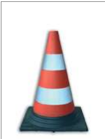
142/1 Cono in gomma h cm. 30 a 2 fasce rifrangenti cl.1 142/2 Cono in gomma h cm. 30 a 2 fasce rifrangenti cl.2