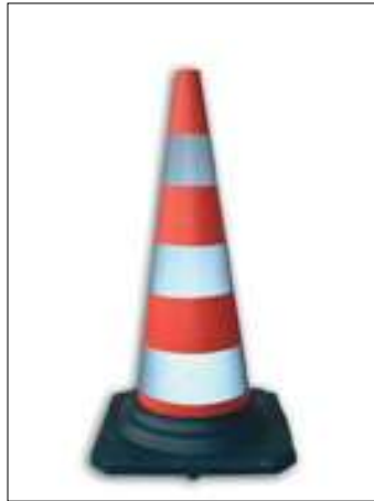
144/1 Cono in gomma h. cm. 50 a 3 fasce rifrangenti Classe 1 144/2 Cono in gomma h. cm. 50 a 3 fasce rifrangenti Classe 2