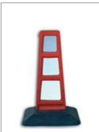
146/1 Delineatore Gommaflex h cm. 33 a 6 inserti rifrangenti cl.1 146/2 Delineatore Gommaflex h cm. 33 a 6 inserti rifrangenti cl.2