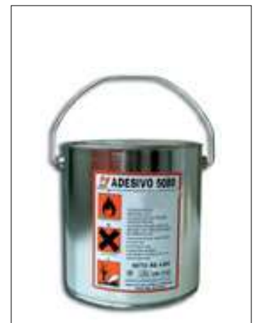
146/C Colla per delineatori in gomma Confezione da 4,5 Kg.