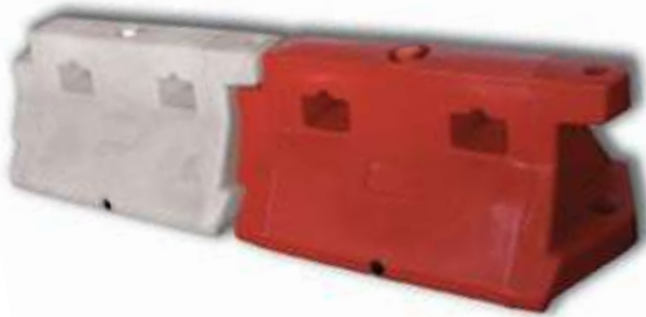
A408 Barriera in polietilene tipo NEW JERSEY mm 1000 x 500 x 500 h